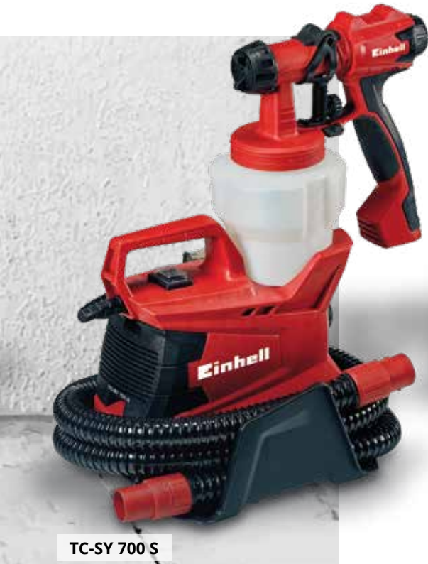
TC-SY 700 S