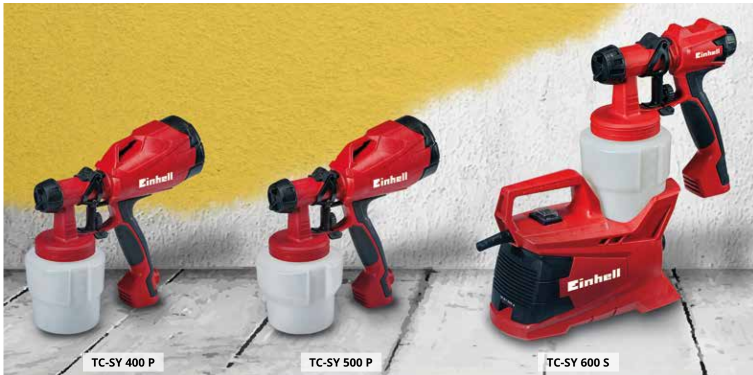
TC-SY 400 P